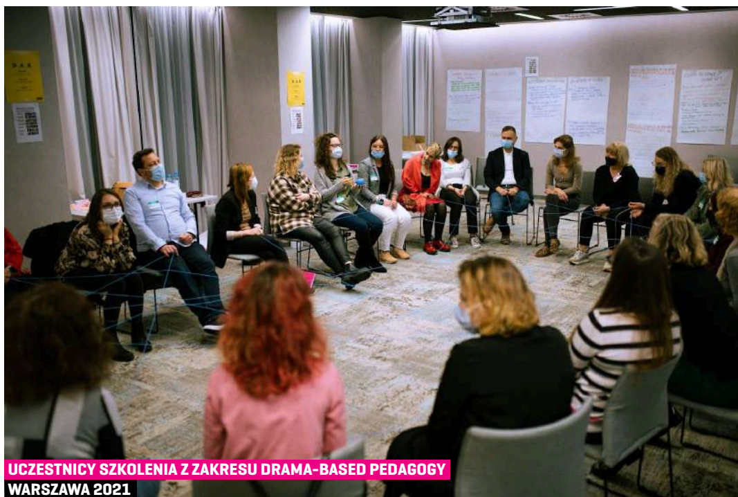
UCZESTNICY SZKOLENIA Z ZAKRESU DRAMA-BASED PEDAGOGY WARSZAWA 2021

Ponadto bycie częścią społeczności jest okazją do dzielenia się doświadczeniem i uczenia się od siebie nawzajem. Rola opiekuna, którą pełnią jest odmienna od tej sprawowanej na co dzień w szkole, co sprzyja bliższemu poznawaniu uczniów i umacnianiu się ich relacji. Wielu nauczycieli postrzega swoje działania w Zwolnionych z Teorii jako spełniające ich zawodowo, dające poczucie misji i dodające skrzydeł w codziennej pracy. Działalność na tym polu jest dla nich dodatkową aktywnością, a mimo to działa ona motywacyjnie i daje dużo satysfakcji. Może ona także być pomocna przy okazji awansu zawodowego nauczyciela czy konkursach i wyróżnieniach.