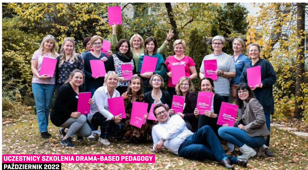
UCZESTNICY SZKOLENIA DRAMA-BASED PEDAGOGY PAŹDZIERNIK 2022

Na platformie Zwolnieni z Teorii znajdują się gotowe do wprowadzenia innowacje pedagogiczne na godzinę wychowawczą, koło zainteresowań oraz lekcje biznesu i zarządzania.