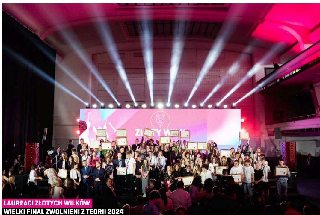
LAUREACI ZŁOTYCH WILKÓW WIELKI FINAŁ ZWOLNIENI Z TEORII 2024

Największą korzyścią dla młodzieży realizującej zespołowe projekty społeczne jest rozwój kompetencji przyszłości – komunikacji, kreatywności, krytycznego myślenia i kooperacji . Ponadto dla uczniów udział w olimpiadzie jest szansą na zdobycie cennych i ciekawych doświadczeń. Realizując swoje projekty społeczne uczą się wielu praktycznych umiejętności, w tym między innymi planowania swoich działań, rozmowy i korespondencji z mediami i potencjalnymi partnerami, czy organizacji wydarzeń. Poza tym pracując w grupach, muszą dzielić zadania adekwatnie do swoich predyspozycji czy rozwiązywać konflikty, co jest cenną lekcją komunikacji i zarządzania. Dla wielu uczestników realizacja projektu była sposobem na nawiązanie relacji z rówieśnikami i znalezieniem swojego miejsca w społeczności szkolnej. Nie sposób nie wspomnieć także o rozwijaniu swoich pasji i niejednokrotnie pierwszej okazji do zrealizowania samodzielnie swojego pomysłu. Buduje to poczucie sprawczości i pewność siebie u uczniów, a często prowadzi do odkrycia tego, czym chcieliby zajmować się w przyszłości. Warto również podkreślić bardzo namacalne korzyści – międzynarodowy certyfikat z zarządzania projektami, który jest ceniony przez wiele zagranicznych uczelni oraz pracodawców w procesie rekrutacji.