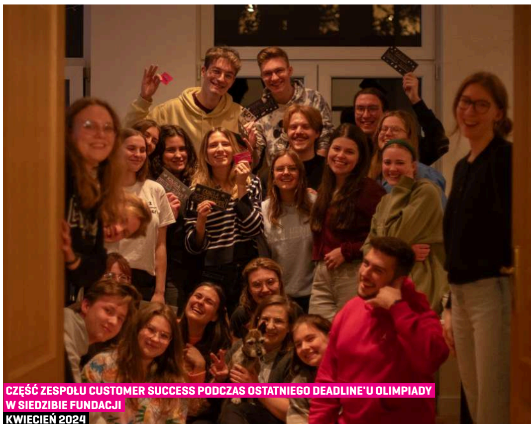
CZĘŚĆ ZESPOŁU CUSTOMER SUCCESS PODCZAS OSTATNIEGO DEADLINE'U OLIMPIADY W SIEDZIBIE FUNDACJI KWIECIEŃ 2024

mailowo pod adresem szkoly@zwolnienizteorii.pl lub telefonicznie pod numerem +48 799 353 223.